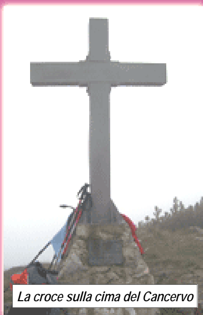
La croce sulla cima del Cancervo