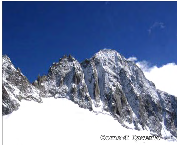
Corno di Cavento