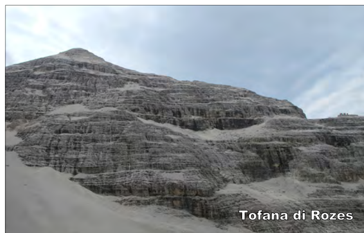
Tofana di Rozes