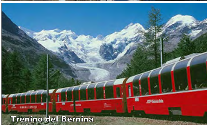
Trenino del Bernina