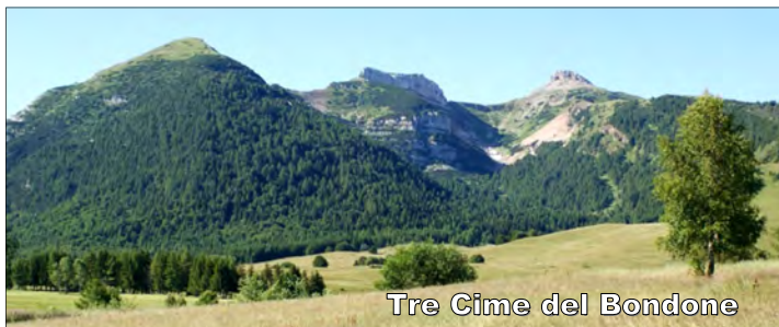
Tre Cime del Bondone