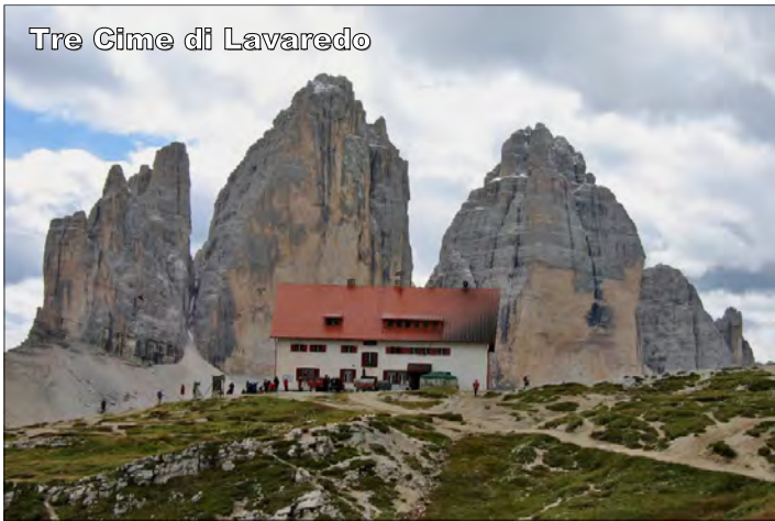
Tre Cime di Lavaredo