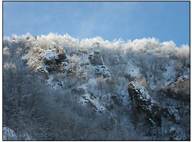
Panorama innevato di Lorenzo G.