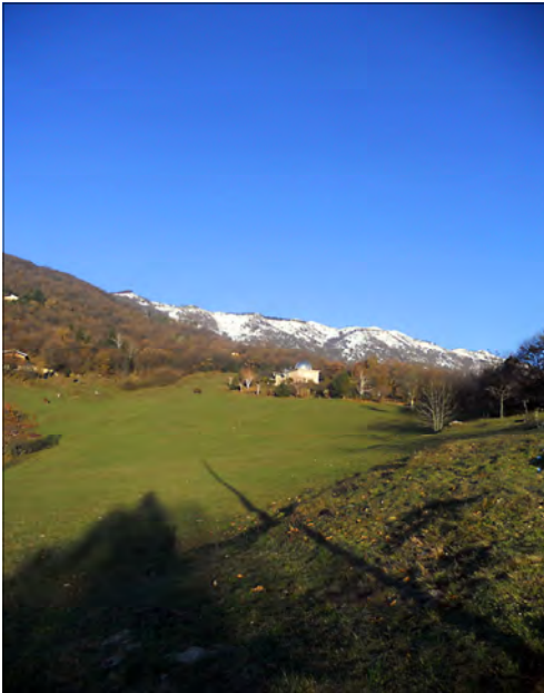
Sonclino da San Bernardo di Sabrina C.