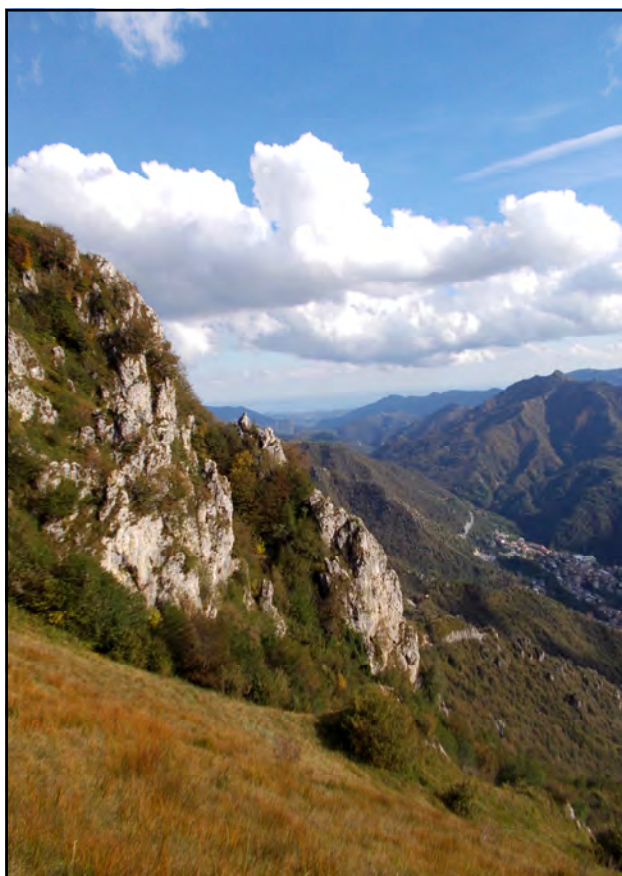
Panorama verso Premiano di Mauro A.