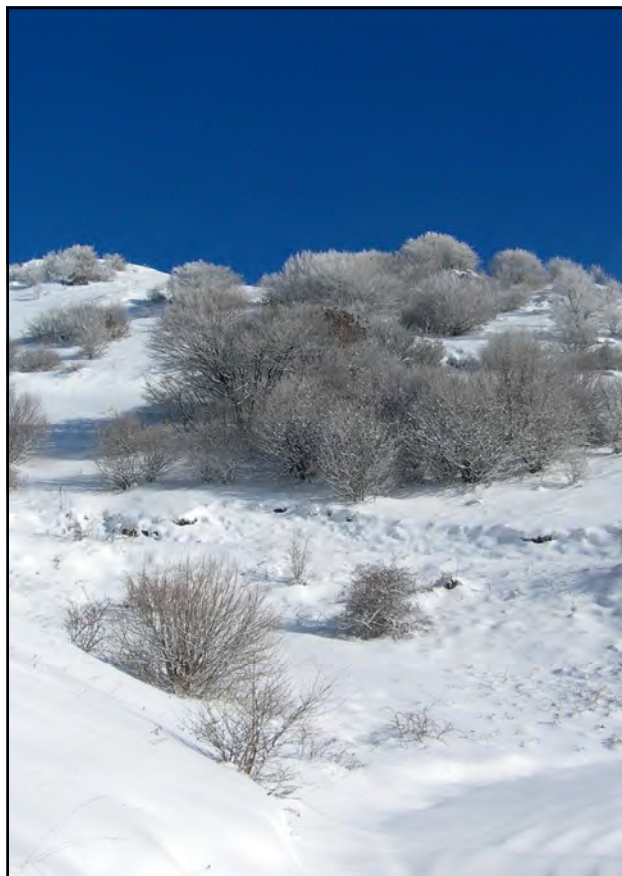
Quarta classificata Neve sul Sonclino di Giuseppe B.

Anche quest'anno la copertina de "Il Ladino" è il risultato di un piccolo concorso fra i soci, giunto alla seconda edizione; li ringraziamo tutti. In queste due pagine presentiamo una fotografia dei soci che hanno partecipato. Ringraziamo il Photoclub Lumezzane per la collaborazione nella scelta.