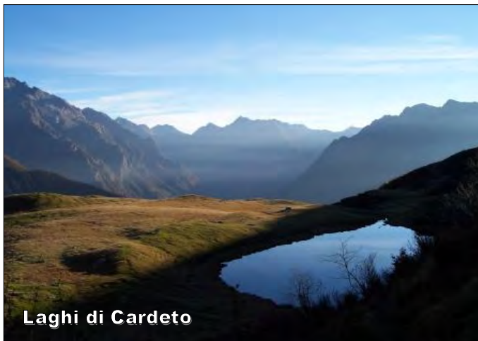
Laghi di Cardeto