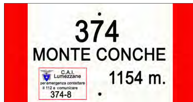
Tabella della località