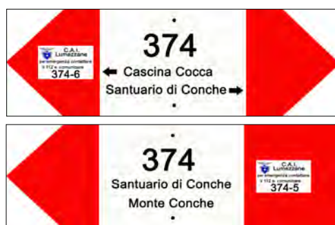
Frecce piccole su paletti