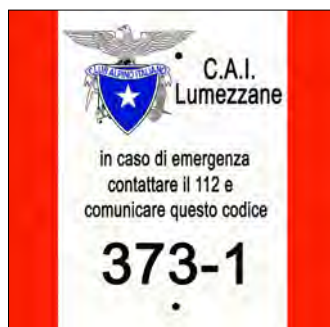
Tabella su palo

Il nostro sito Internet, www.cailumezzane.it/sentieri , è sempre aggiornato su tutto ciò che riguarda i nostri sentieri; descrizioni degli itinerari, foto, itinerari scaricabili in GPX, informazioni culturali sui luoghi attraversati e tante altre notizie interessanti.