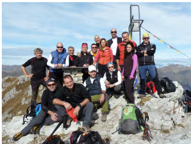
FOTO DI VETTA PRESSO LA CROCE

e mi ha permesso ancora una volta di apprezzare la montagna e poter dire che: chi lo desidera, può arrivare in cima. Solo un passo dietro l'altro.