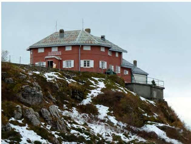
NEI PRESSI DEL RIFUGIO CAZZANIGA