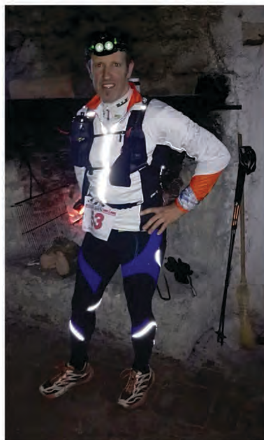
PRONTI PER UNA NUOVA GARA