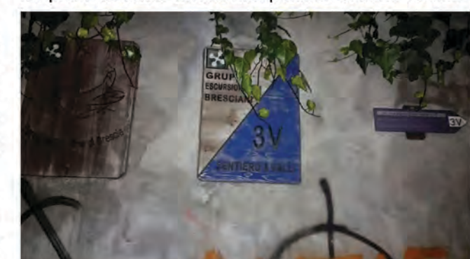
CARTELLI INDICATORI AL 3V RANDO TRAIL

In quel momento tutti i miei pensieri si sono focalizzati su tutto l'allenamento fatto da Ottobre a Luglio, le corse in montagna, lo scialpinismo, le salite alpinistiche ed in più la palestra; insomma tanti sacrifici e molti, molti km percorsi (1.000 km 70.000 mt di dislivello).