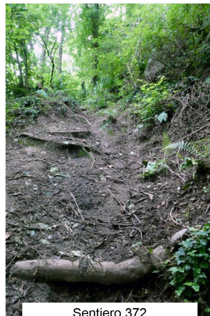
Sentiero 372 Prima e dopo l'intervento