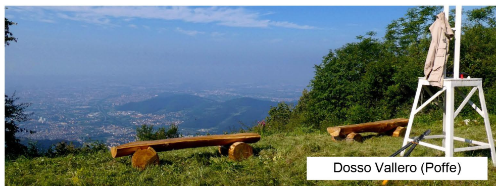
Dosso Vallero (Poffe)