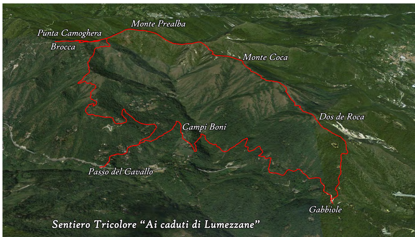
Sentiero Tricolore "Ai caduti di Lumezzane"