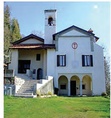
SANTUARIO S. EMILIANO

Ed è così che, anche nella modernità, arte e fede, tradizione e cultura, memoria e trasmissione diventano un indispensabile strumento di persistente forma di vita religiosa: è, un po', quello che la "Santella Giori", costruita appunto dai fratelli Giori in virtù di una promessa di devozione, costituisce, oggi, per i passanti verso il più noto santuario di S. Emiliano.