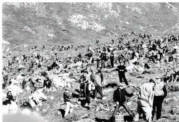
Giornata degli alberi a Piass dei Gri nel 1987

Si narra che Uberto, un venerdi santo, fosse andato a caccia, anziché a Messa. Giunto in una radura vide uno splendido esemplare di cervo maschio adulto, con un superbo palco di corna. Nonostante la presenza del cacciatore, la preda non fuggì, si girò e fissò Uberto negli occhi. Mentre Uberto guardava, stupito, vide apparire tra le corna dell'animale una luce, che prese la forma di una Croce luminosa e si udirono le seguenti parole: "Uberto, Uberto, convertiti e ritorna a Dio".